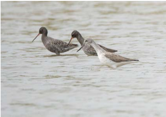
Zwarte Ruiters en Groenpootruiter

Harvey van Diek verraste ons met deze fraaie foto's, gemaakt op 28 april bij de nieuwe plassen.