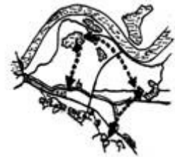
Ecologische verbindingen in de Ooijpolder

Stapsteen 't Zwanenbroekje is een particulier initiatief, ongeveer tien jaar geleden gestart, waarbij landbouwgronden worden omgezet in natuur. De overheid wil natuurbeheer door particulieren stimuleren. 't Zwanenbroekje is hiervan een voorbeeld. Bij de inrichting van het gebied wordt gestreefd naar een zo groot mogelijke variatie passend bij het landschap, zodat zoveel mogelijk planten en dieren zich er thuis kunnen voelen. Het gebied vormt een stapsteen in de ecologische verbindingzone door de Ooijpolder tussen de stuwwal bij Ubbergen en de uiterwaarden langs de rivier de Waal. 't Zwanenbroekje werkt samen met het IVN, vereniging voor natuur- en milieueducatie, afdeling Rijk van Nijmegen.