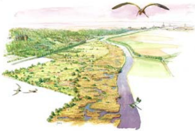
Natuurgebied 't Zwanenbroekje