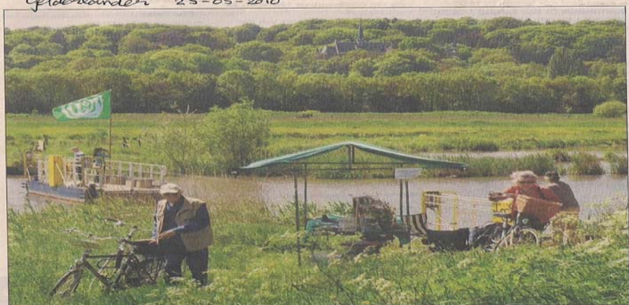
Fietsend door de Ooij, hier bij het trekpontje en het nieuwe moeras.

ven. Onderweg zijn zes informatiepunten neergezet waar de fietsers mee kunnen doen aan verschillende activiteiten. Langs de Oude Waal is het turen geblazen naar sloebenden, tureluurs en grutto's. In Persingen kun je met het trekpontje het Meertje oversteken om het nieuwe moerasgebied te ontdekken. Toen eigenaar Hans Maertens