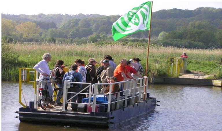
22 mei; de werkgroep Praktisch Natuurbeheer steekt van wal

Op deze zaterdag boden de gezamenlijke natuurorganisaties het publiek de mogelijkheid vogels te observeren bij de moerassen in de Ooijpolder. Langs de Waalbandijk was er veel belangstelling. Langs het Meer was dat minder. Maar de stemming was zeer geanimeerd. De werkgroepen Excursies en Jeugdeducatie van het IVN verzorgden wandelingen en onderzoek van waterbeestjes op 't Zwanenbroekje en de werkgroep Praktisch Natuurbeheer stak de handen uit de mouwen.