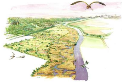
Natuurgebied 't Zwanenbroekje