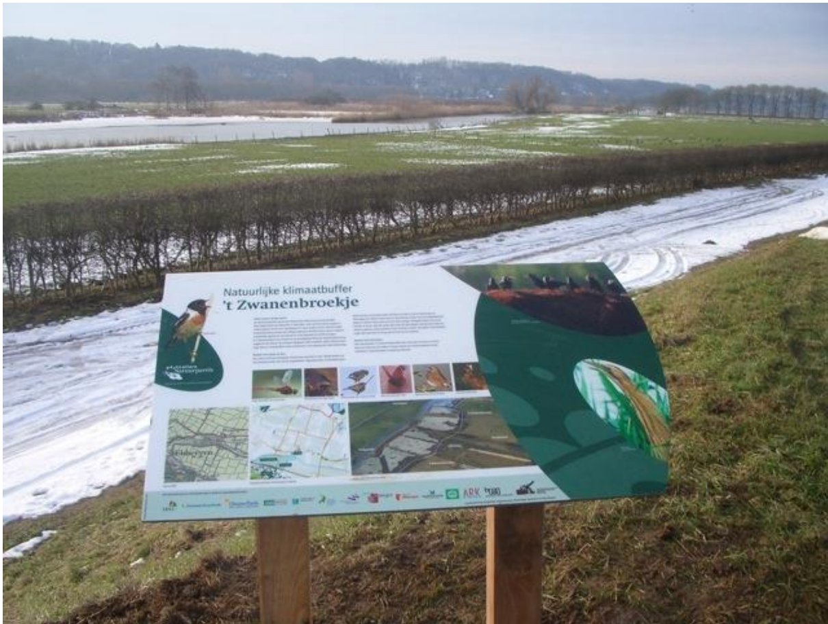
't Zwanenbroekje vanaf het kerkje van Persingen

Wandelpad langs het Meer: rechts de nieuwe rietmoerassen; deze zijn in december 2008 gegraven. Het is het herstel van de vroegere situatie. Vogelbescherming en andere organisaties hechten hier veel waarde aan. Zij hopen dat zich hier bijzondere rietvogels zullen vestigen zoals de Roerdomp en de Grote Karekiet. Het gebied gaat ook dienen als klimaatbuffer als naar verwachting in de toekomst meer water zal moeten worden opgeslagen. Het geld voor de aanleg werd o.a. verkregen van de Postcodeloterij.